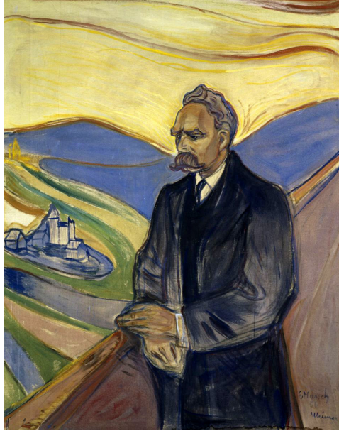
Edvard Munch, Friedrich Wilhelm Nietzsche'nin portresi (1906) The Thiel Gallery Stockholm