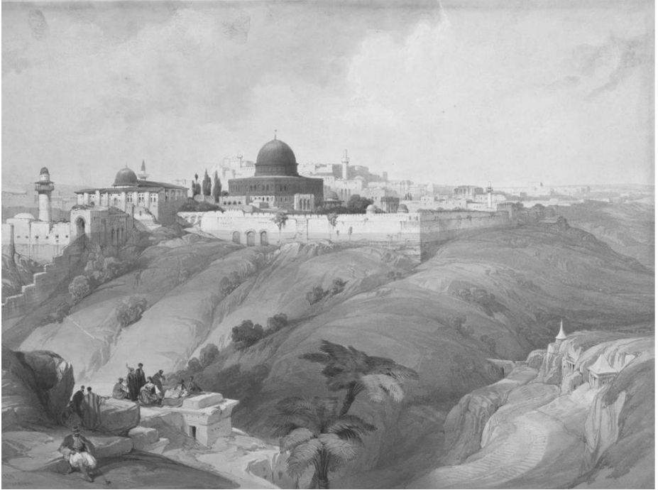
David Roberts tarafından 1839 yılında yapılmış bir Kudüs resmi. (Cleveland Museum of Art, Ohio, ABD)